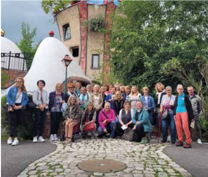
■ Jubiläumsausflug zum Hundertwasserturm nach Abensberg

Unter dem Motto „Every Raindrop is a Kiss from Heaven“ von Friedrich Hundertwasser machten sich unsere Helferinnen der Kleiderläden Kolbermoor und Wasserburg auf den Weg nach Abensberg, um gemeinsam einen ganz besonderen Anlass zu feiern: 20 Jahre Kleiderladen! Ein Doppeljubiläum, das vor allem eines bedeutet: Dankbarkeit, Zusammenhalt und Freude.