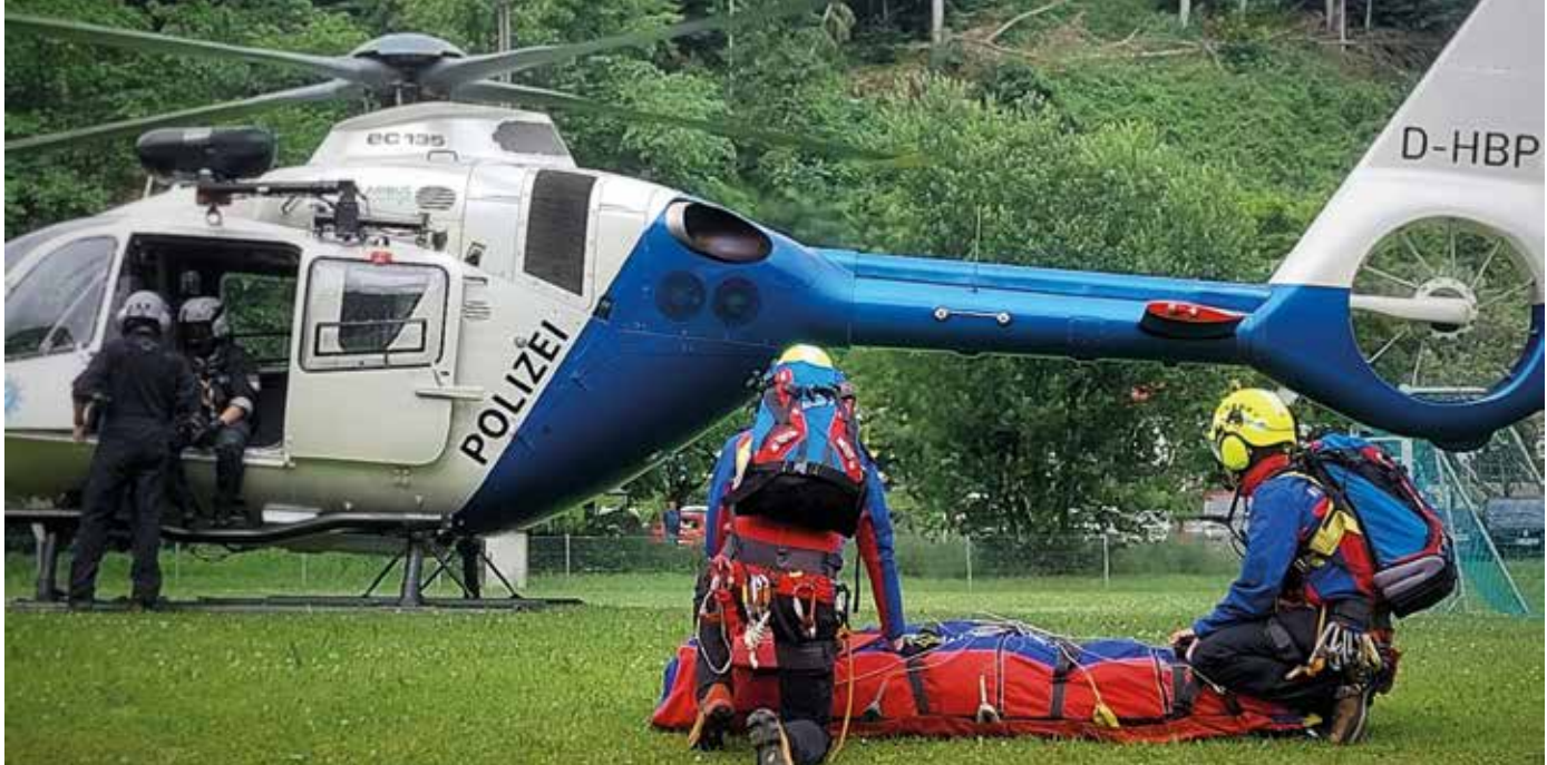
■ Jährliches Echtflugtraining – aufregend und notwendig