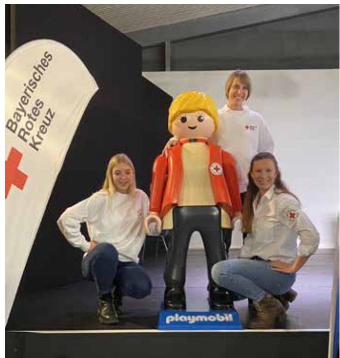
► Das Team der Bereitschaft Bad Endorf auf dem Neubürgerempfang

Die Marktgemeinde Bad Endorf veranstaltet jährlich einen Neubürgerempfang, auf dem sich Vereine und Organisationen den neuen Mitbürgern präsentieren können. Auch die BRK-Gemeinschaften waren vor Ort und nutzten die Gelegenheit, neue Kontakte zu knüpfen.