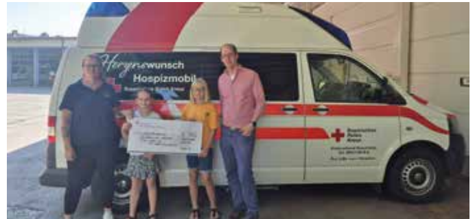
■ Die Vertreter der Grundschule Großkarolinenfeld übergeben Spende