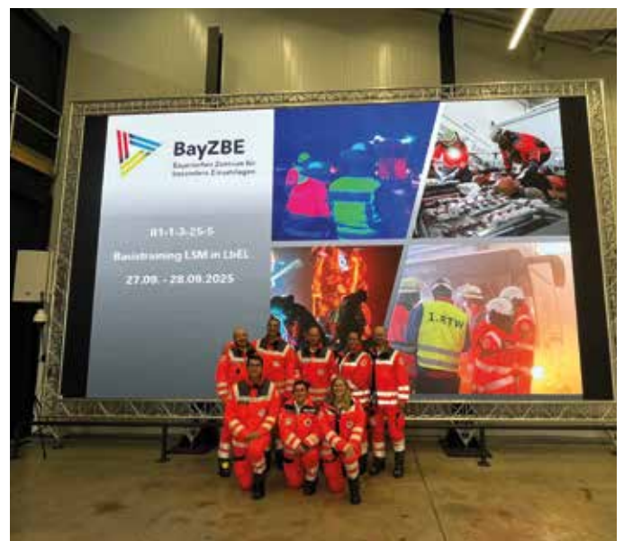
■ Die Teilnehmergruppe beim BayZBE

Neun Einsatzkräfte besuchten das Bayerische Zentrum für besondere Einsatzlagen (BayZBE) in Windischeschenbach. Dort übten sie lebensrettende Sofortmaßnahmen wie Tourniquets und Rettungstechniken und profitierten von praxisnahen Szenarien mit ausführlicher Nachbesprechung.