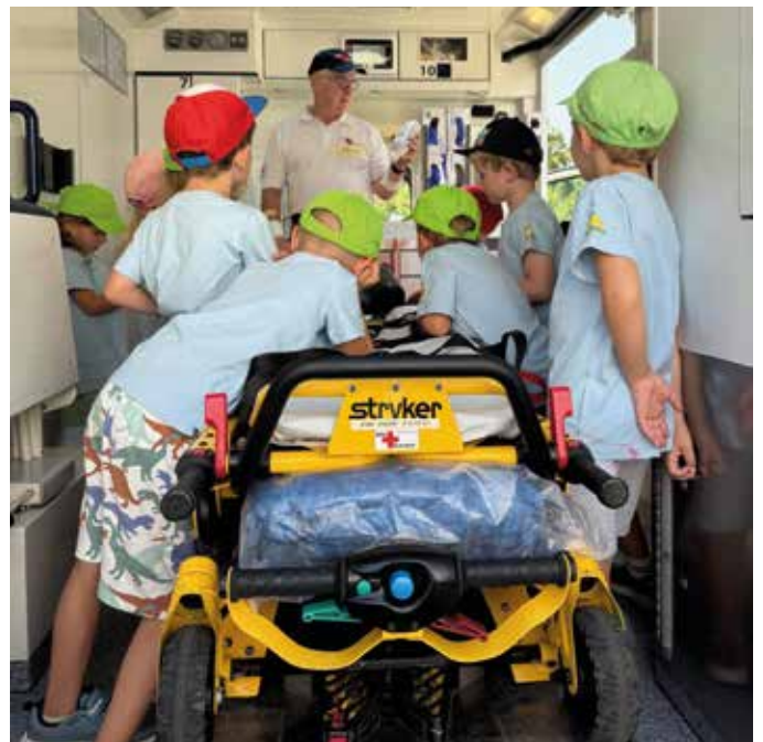
■ Von großem Interesse war die Besichtigung des RTWs