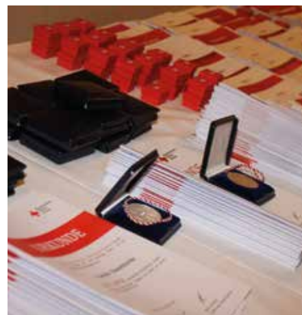
■ Wir bedanken uns bei den langjährigen Fördermitgliedern und Vielfach-Blutspendern für ihre Unterstützung.