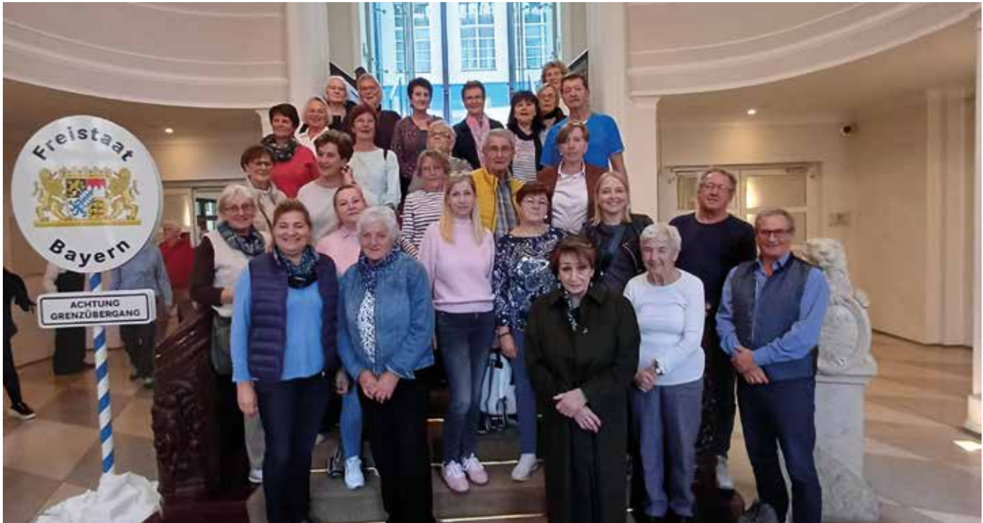
■ Auf Einladung unserer Vorsitzenden und Mitglied des Bundestags Daniela Ludwig ging es für die WuS-Mitglieder nach Berlin

Auf Einladung unserer Vorsitzenden und Parlamentarischen Staatssekretärin des Bundesministers des Innern, Daniela Ludwig, begaben sich Mitglieder der Sozialen Arbeitskreise, der Kleiderläden und der Tafel Raubling vom 15. bis 18. Oktober auf eine eindrucksvolle Bildungs- und Begegnungsfahrt nach Berlin.