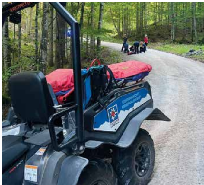
■ E-Bike Unfall an den Audorfer Almen

Der Verletzte wurde schonend ins Tal transportiert, am Parkplatz Gießenbach vom Notarzt untersucht und anschließend zur Bergrettungswache gebracht. Von dort erfolgte der Weitertransport ins Krankenhaus.