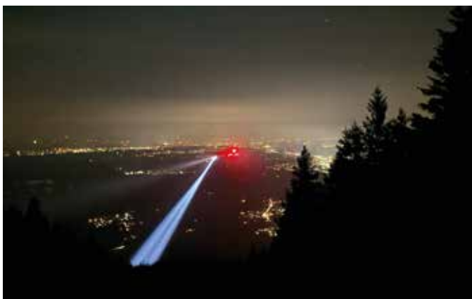
■ Die einbrechende Dunkelheit erschwerte die Heli-Rettung

Die Einsatzkräfte der Bergwacht brachten den Patienten zu einer kleinen Lichtung etwa 100 Meter oberhalb der Unfallstelle. Dort konnte der nachflugtaugliche Rettungshubschrauber RK3 aus Reutte den Patienten sicher per Winde aufnehmen und abtransportieren. An dem Einsatz beteiligt waren unter anderem Elias Grottke sowie Norbert Fritsch, die maßgeblich zum erfolgreichen Rettungseinsatz beitrugen.