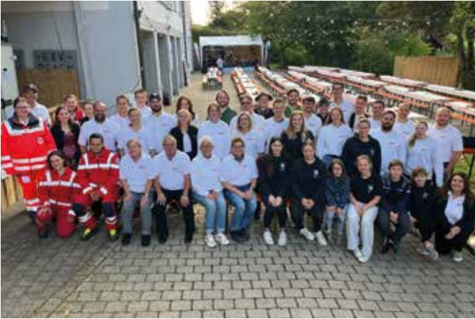
■ Das Helferteam sorgte für ein tolles Jubiläumsfest

Die Bereitschaft Bad Endorf feierte ihr 95-jähriges Bestehen mit einem gemütlichen Weinfest. Es kamen viele Gäste aus dem Ort, aus den anderen BRK-Gemeinschaften und ehemalige Kameraden.