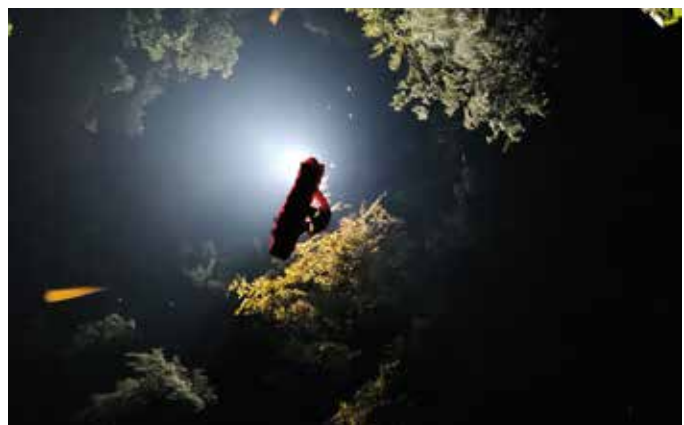
■ Aufnahme des Patienten an einer Lichtung