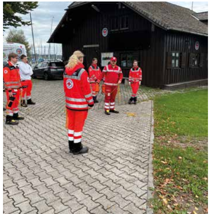
■ Zu Besuch bei der Wasserwacht in Prien