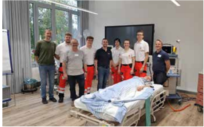
■ Das Training war für die Teilnehmer besonders wertvoll

Der Schockraum ist die Schnittstelle zwischen Präklinik und innerklinischer Notfallversorgung. Hier arbeiten Teams unter hohem Zeitdruck zusammen, um Patientinnen und Patienten bestmöglich zu versorgen. Klare Abläufe und gute Zusammenarbeit sind entscheidend – sowohl für die Sicherheit der Patienten als auch der Mitarbeitenden. Im Oktober begleiteten wir zwei Trainingstermine im Fort- und Weiterbildungszentrum des RoMed Klinikums Rosenheim. Rettungsdienstteams aus NotSan-Azubis des zweiten Ausbildungsjahres sowie Rettungssanitäter und Notfallsanitäter versorgten realistisch geschminkte Übungspatienten mit unterschiedlichen Notfallsituationen. Danach