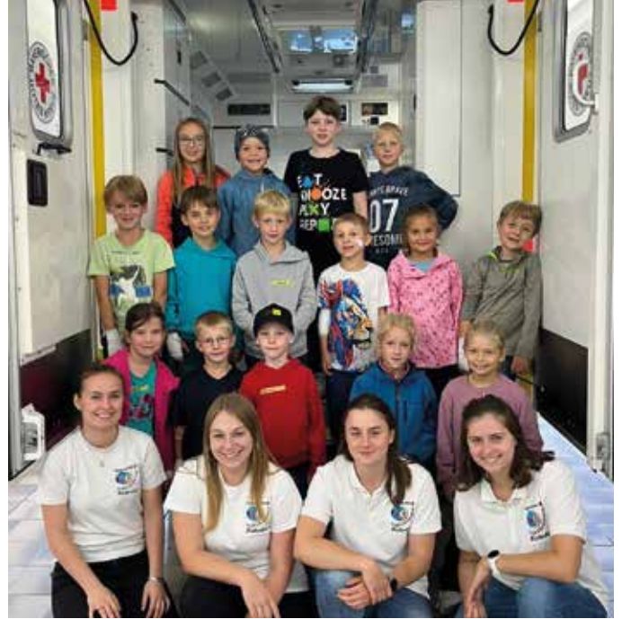
■ Eine der drei Feriengruppen