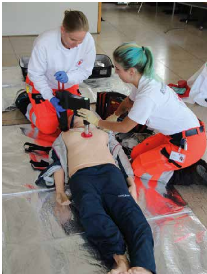
■ Reanimation mit einer mechanischen Reanimationshilfe zur Thoraxkompression (mCPR)

Ein weiterer Schwerpunkt war das Reanimationstraining, das in diesem Jahr erstmals mit dem neuen mechanischen Reanimationsgerät „corpuls cpr“ kombiniert wurde. Nach der gesetzlich vorgeschriebenen Einweisung übten die Teilnehmenden Szenarien wie Säuglings- und Kinderreanimation, Traumareanimation oder Reanimation unter schwierigen Bedingungen. Ziel war es, die Basismaßnahmen sicher und souverän umzusetzen, auch wenn Stress, Ablenkungen oder besondere Umstände hinzukommen.