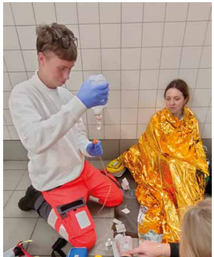
■ Vorbereiten einer Infusion