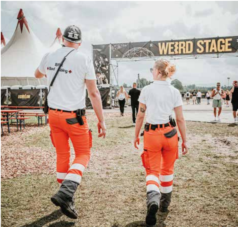
■ Das Echelon-Festival brachte viele Techno-Fans nach Mietraching (Archivfoto)

Das Echelon Festival zog auch in diesem Jahr wieder tausende Musikbegeisterte auf das ehemalige US-Kasernengelände. Die Besucher feierten nationale und internationale DJs aus House und Electro vor Ort. Durch ein heftiges Unwetter musste die Veranstaltung jedoch vorzeitig beendet werden.