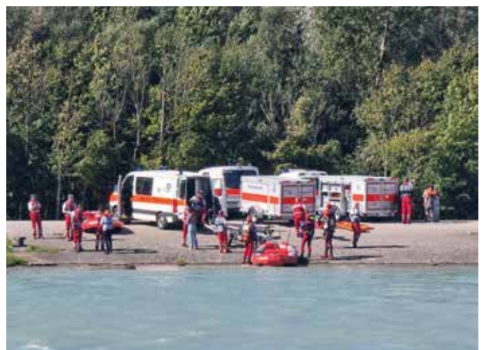
■ SEG-Übung, um in Notlagen bestmöglich vorbereitet zu sein

Im September fand eine groß angelegte Übung des Wasserrettungszuges statt, an der mehrere Ortsgruppen aus dem Landkreis Rosenheim teilnahmen, darunter auch sieben SEG-Mitglieder der Wasserwacht Bad Aibling. Ziel der Übung war es, die Einsatzkräfte bestmöglich auf reale Notlagen vorzubereiten und die Zusammenarbeit unter anspruchsvollen Bedingungen zu trainieren. Der Wasserrettungszug, den die beteiligten Einheiten gemeinsam bildeten, wurde zu einer Evakuierung am Inn alarmiert. Dort wurden zahlreiche Personen erfolgreich abtransportiert. Insgesamt bot die Übung eine wertvolle Gelegenheit, gemeinsam zu arbeiten und sich gezielt auf reale Großschadensereignisse vorzubereiten.