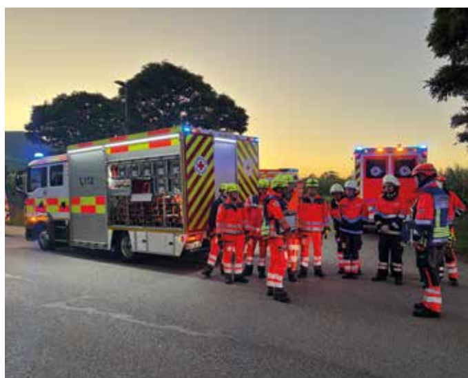
■ Die Rotkreuzler warten auf ihren Einsatz

Alle Beteiligten zogen ein positives Fazit. Für die Rohrdorfer Helfer war die Großübung eine wertvolle Gelegenheit, Abläufe in der Praxis zu trainieren, neue Geräte zu erproben und die Teamarbeit in realistischen Szenarien zu stärken.