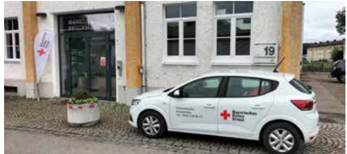
■ Bürgersprechstunde in Bruckmühl

Die ersten Termine gelten auch als Test, ob dieses Format von den Bürgern angenommen wird.