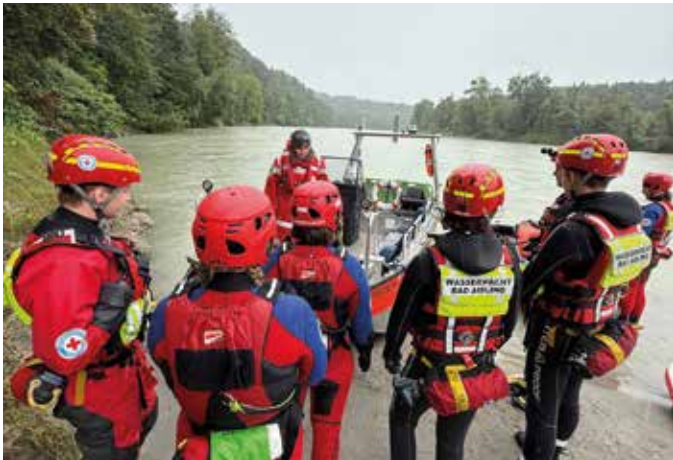
■ Realistische Szenarien zeigen die Herausforderungen der Wasserrettung

Anfang August hatte unsere Jugend-SEG (Schnelleinsatzgruppe) aus Bad Aibling die ganz besondere Möglichkeit gemeinsam mit der Jugend-SEG der Ortsgruppe Wasserburg an einer spannenden und ortsrgruppenübergreifenden Übung am Inn teilzunehmen.