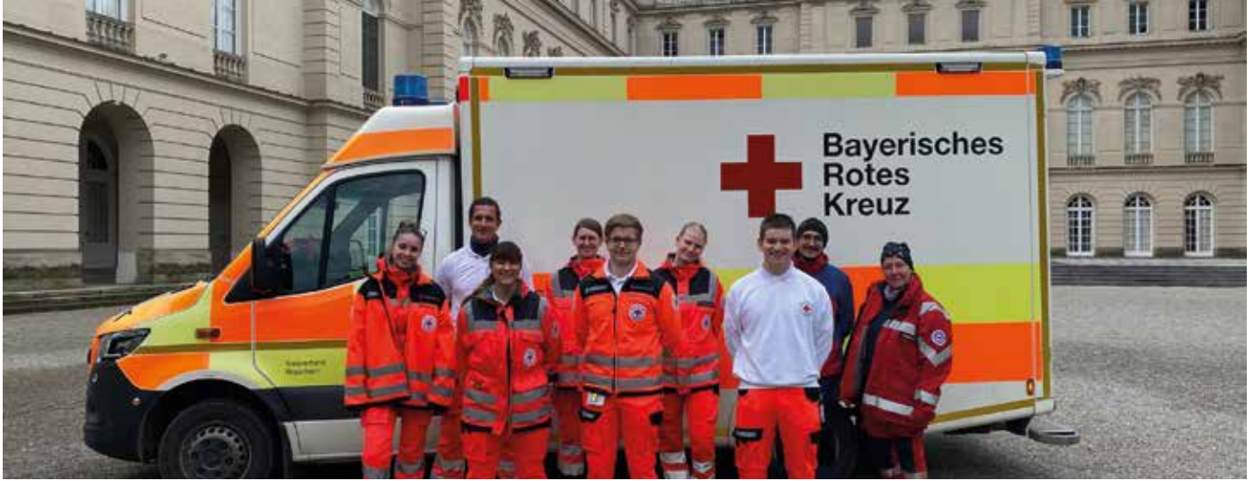
■ Einzigartig in Bayern: Inselrettungsdienst - hier die Azubis vor Schloss Herrenchiemsee.