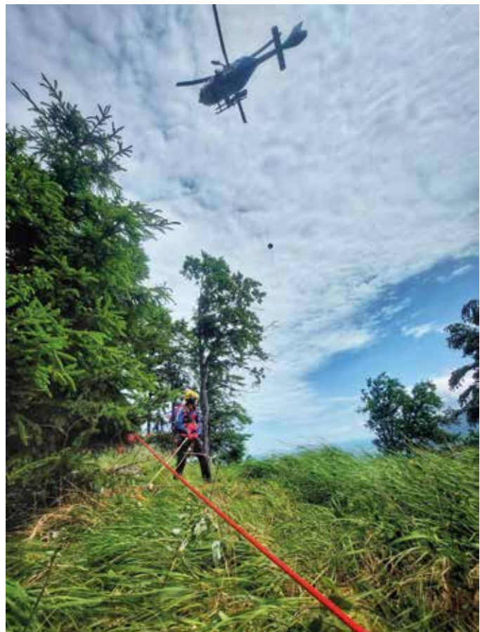
■ Die Bergwachtkameraden warten an der Waldlichtung

Für alle Beteiligten war das Training erneut eine lehrreiche und beeindruckende Erfahrung. Ein herzliches Dankeschön geht an die Crew der Polizeihubschrauberstaffel Roth für die reibungslose Zusammenarbeit – schön, wenn man sich blind aufeinander verlassen kann.