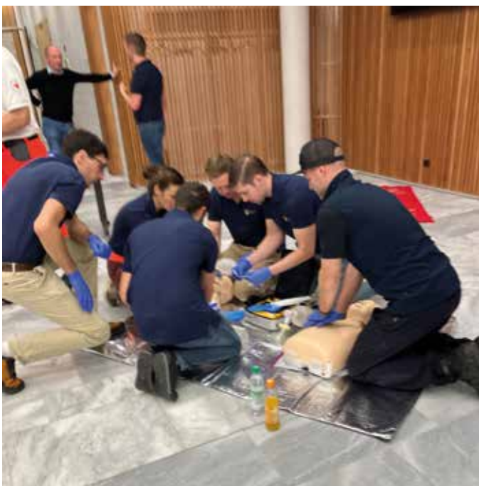
■ Praktische Übungen unter Anleitung erfahrener Ausbilder

Im Oktober fand erstmals ein Kindernotfalltraining des BRK-Kreisverbands Rosenheim im Landratsamt Rosenheim statt. Dabei erhielten Angehörige der First Responder- und Helfer-vor-Ort-Einheiten (FR/HvO) im Bereich der Integrierten Leitstelle Rosenheim (ILS) eine praxisnahe Fortbildung zum Thema Kinder- und Säuglingsreanimation. Organisiert wurde die Veranstaltung vom Zweckverband für Rettungsdienst und Feuerwehralarmierung (ZRF) Rosenheim.