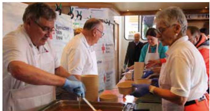
■ Viele helfenden Hände kümmern sich um die Gäste

Am 11. Oktober fand die 52. Chiemseeschiffahrt für Senioren und Menschen mit Behinderung statt. Die Veranstaltung der fünf Kreisverbände des BRK – Altötting, Ebersberg, Mühldorf, Rosenheim (federführend in der Organisation) und Traunstein erfreute sich auch in diesem Jahr großer Beliebtheit.