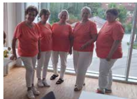
■ Die fleißigen Helferinnen im neuen Outfit

Die Leiterinnen der Gemeinschaften für Wohlfahrt und Sozialarbeit unseres Kreisverbandes kamen zu einem wichtigen Treffen in der Kulturmühle Bruckmühl zusammen. Die stilvollen und freundlichen Räumlichkeiten boten den passenden Rahmen für einen regen Austausch. Gastgeber war dieses Mal der Soziale Arbeitskreis Bruckmühl, der mit viel Engagement die Organisation übernommen hatte. Die Helferinnen und Helfer überraschten die