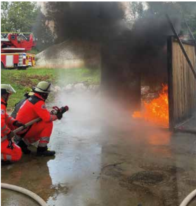
■ Üben mit der Feuerwehr

Zum Abschluss gewährte auch die Feuerwehr Rosenheim spannende Einblicke in ihr breites Einsatzspektrum.