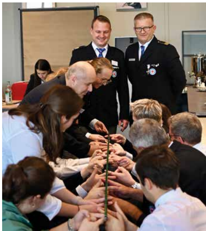
■ Teamdynamik im Führungskräfte-Coaching

Darüber hinaus bot die Veranstaltung Raum für Austausch, Vernetzung und den Blick auf zukünftige Entwicklungsfel-