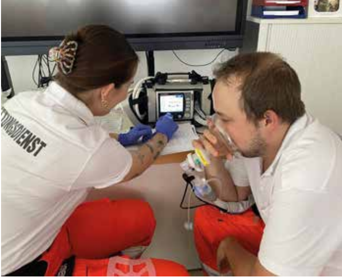
■ Beatmungsworkshop - Üben an verschiedenen Geräten