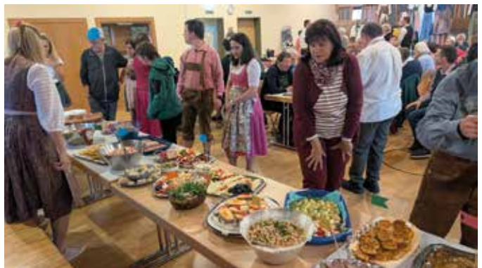
■ Ansturm auf das Buffet

das reichlich bestückte Buffet. Von Quiche über Salate und gebackenen Köstlichkeiten war für jeden etwas dabei. Wir sagen allen Spendern ein herzliches Dankeschön. So war unser Herbstfest wieder ein voller Erfolg.