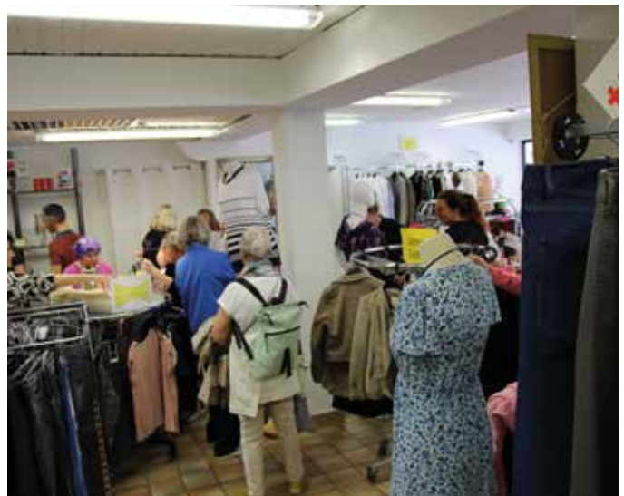
■ Andrang beim Jubiläumsverkauf in Oberaudorf

Zum Abschluss gab es ein feines Essen in gemütlicher Runde. Es wurde gelacht, erzählt und erinnert – viele schöne Geschichten aus zwei Jahrzehnten Kleiderladen kamen wieder hoch. Dieser Tag war vor allem eines: ein großes Dankeschön an unsere wunderbaren Helferinnen. Für ihren Einsatz, ihre Herzlichkeit, ihre Zeit und ihr offenes Ohr – Tag für Tag, Jahr für Jahr. Jeder Moment dieses Ausflugs – und jeder Regentropfen – war wie ein kleiner Kuss des Himmels, der uns daran erinnert, wie wertvoll Gemeinschaft ist.