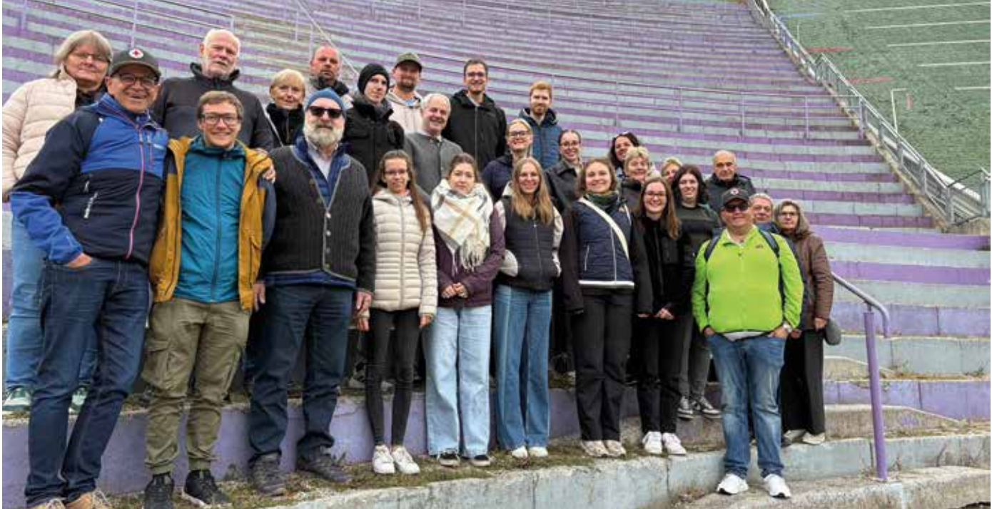
■ Der Ausflug nach Südtirol stärkte die Gemeinschaft