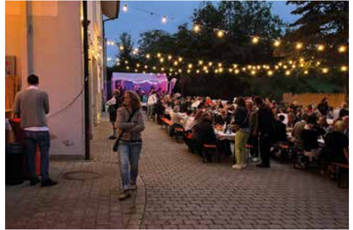
■ Hervorragende Stimmung herrschte auf dem Weinfest

Die Bereitschaft Bad Endorf feierte ihr 95-jähriges Bestehen mit einem gemütlichen Weinfest. Es kamen viele Gäste aus dem Ort, aus den anderen BRK-Gemeinschaften und ehemalige Kameraden.