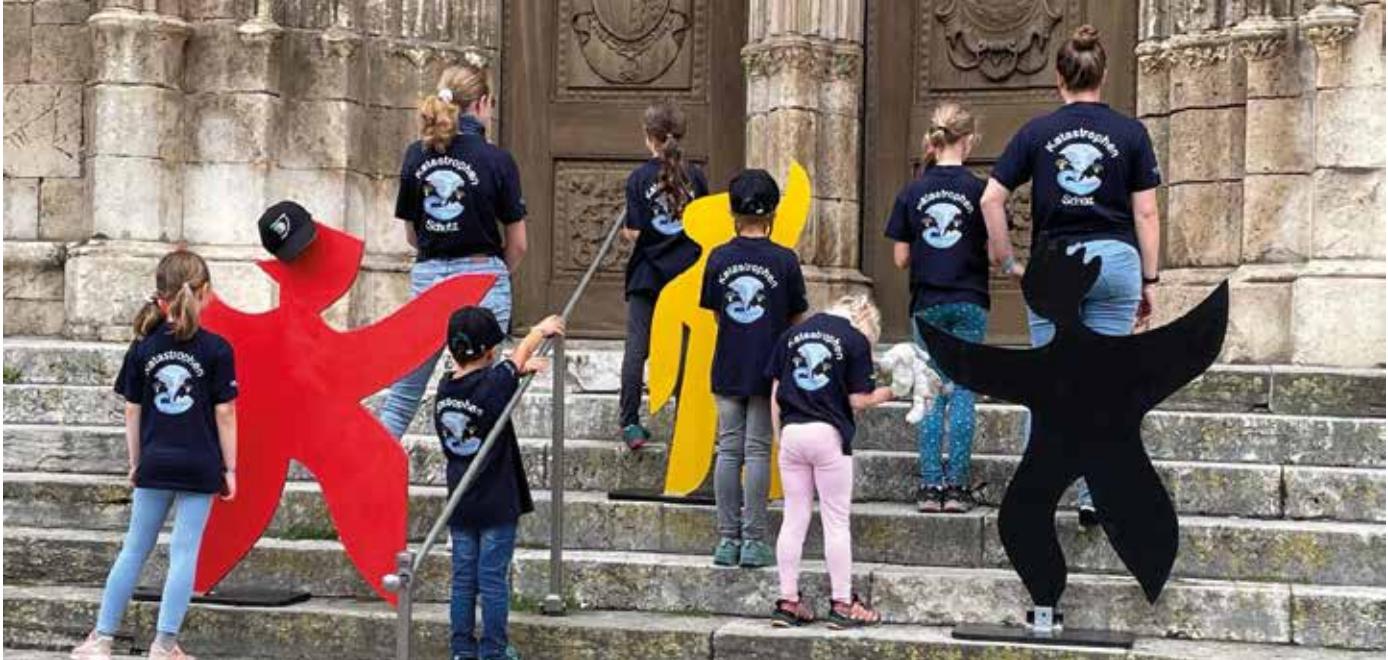
■ Der Wettbewerbsparcours führte durch die Regensburger Altstadt