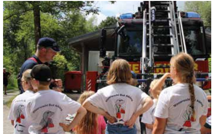
■ Interessante Vorführung der Feuerwehrdrehleiter

► Die Teilnehmer des Zeltlagers hatten ein tolles Wochenende