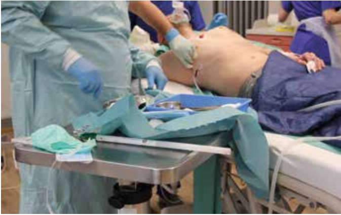
■ Anlage einer Thoraxdrainage im Schockraum

Der Schockraum ist die Schnittstelle zwischen Präklinik und innerklinischer Notfallversorgung. Hier arbeiten Teams unter hohem Zeitdruck zusammen, um Patientinnen und Patienten bestmöglich zu versorgen. Klare Abläufe und gute Zusammenarbeit sind entscheidend – sowohl für die Sicherheit der Patienten als auch der Mitarbeitenden. Im Oktober begleiteten wir zwei Trainingstermine im Fort- und Weiterbildungszentrum des RoMed Klinikums Rosenheim. Rettungsdienstteams aus NotSan-Azubis des zweiten Ausbildungsjahres sowie Rettungssanitäter und Notfallsanitäter versorgten realistisch geschminkte Übungspatienten mit unterschiedlichen Notfallsituationen. Danach