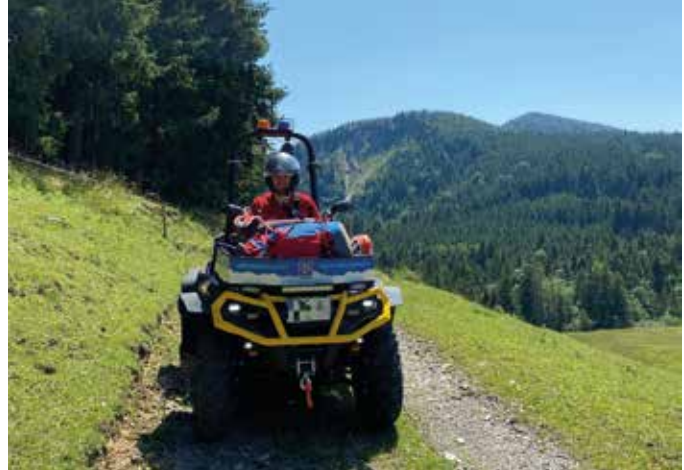
■ Rettung eines Gleitschirmfliegers aus unwegsamem Gelände

Am gleichen Tag wurde die Bergwacht Bad Feilnbach zu einem weiteren Gleitschirmunfall alarmiert. Der Pilot blieb unverletzt, befand sich jedoch in unwegsamem Gelände.