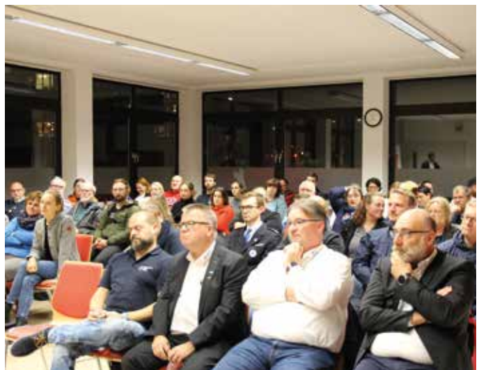
■ Aufmerksam verfolgen die Zuhörer den Vortrag