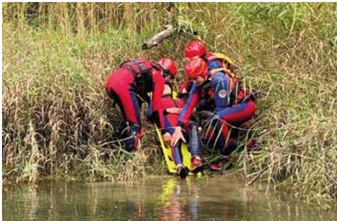
■ Erste Lageübersicht beim Patienten

Zurück auf der Sandbank folgte das nächste Szenario: die Rettung einer verletzten Person über einen tiefen Bachlauf. Nach kurzer Abstimmung schwammen die Retter mit einem Spineboard zum Patienten, beruhigten ihn und bereiteten den Transport vor. Auf der Trage wurde der Verunfallte sicher zur Sandbank gebracht und dort weiter versorgt. Nach dieser intensiven Übung ließen alle den Tag bei einem gemütlichen Kameradschaftsabend mit Grillfleisch und Getränken ausklingen. Der Dank geht an die Organisatoren!