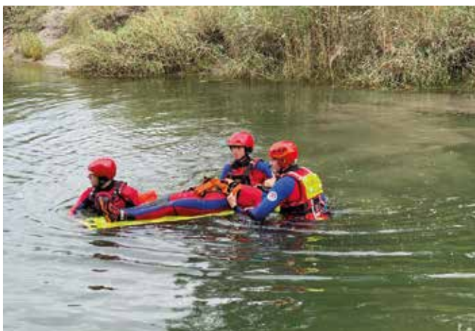
■ Transport über das Gewässer