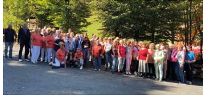
■ Zum Abschluss ein Erinnerungsfoto