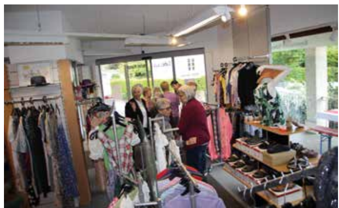
■ Der Laden in Bad Endorf öffnet jetzt auch jeden 1. Samstag im Monat

„Wir freuen uns sehr, mit unserer Spende einen Beitrag zu diesem berührenden Projekt leisten zu können“, so die Vertreterinnen der kfd Kolbermoor. „Es ist uns ein großes Anliegen, Menschen am Lebensende noch ein Stück Lebensqualität und Herzensfreude zu ermöglichen.“