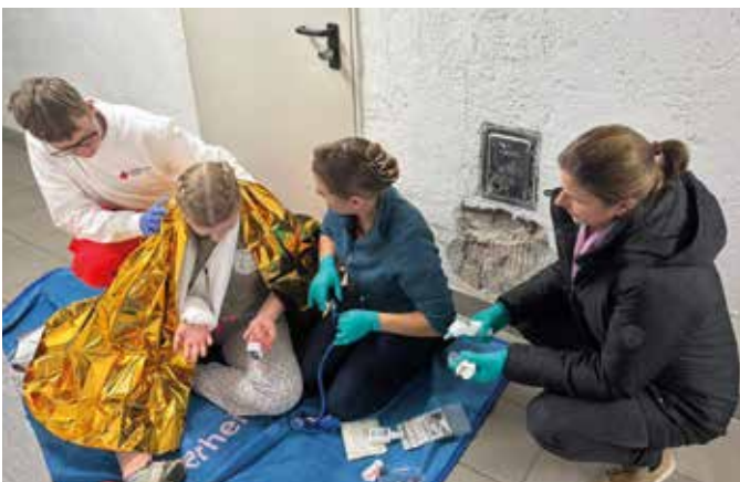
■ Versorgung einer gestürzten Person

Wir bedanken uns recht herzlich für die Organisation des spannenden Übungsabends.