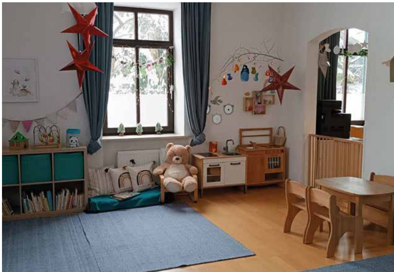
■ Kindgerechte Einrichtung für eine Betreuung der Kleinsten in geborgener Umgebung

Seit September 2020 betreut die BRK-Großtagespflege „Die Seewichtel“ in Prien Kinder im Alter von ein bis drei Jahren. In den vergangenen fünf Jahren hat sich die Einrichtung als verlässliche Anlaufstelle für viele Familien etabliert.