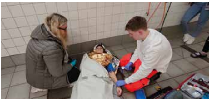
■ Blutdruckmessen an unterkühlter Person