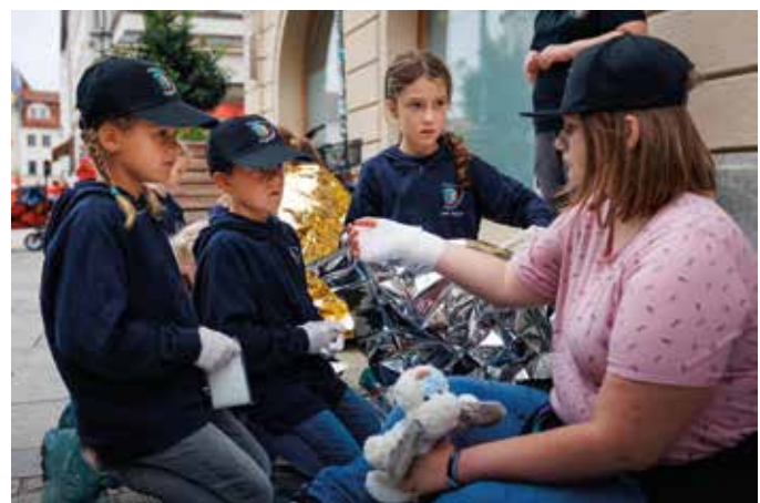
■ Erste-Hilfe-Maßnahmen sicher und korrekt umsetzen!