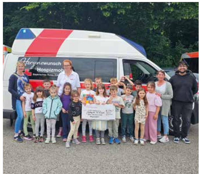
■ Kinder des Kindergarten St. Michael ihren Betreuern mit Spendenscheck

Wir bedanken uns herzlich bei den Kindern, dem gesamten Team des Kindergartens St. Michael sowie den Eltern für diese wunderbare Aktion und ihre Unterstützung unserer Herzenswunsch-Initiative.