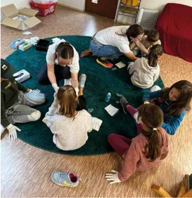
■ Verbandanlegen leicht gemacht