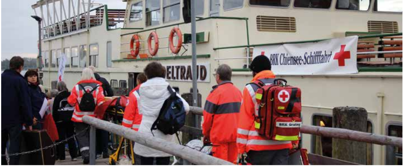
■ Mit der "Edeltraud" auf dem Chiemsee unterwegs