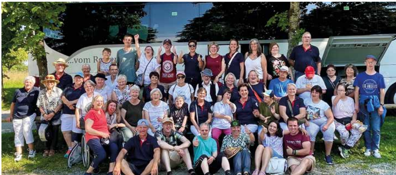
▼ Gute Laune bei den Ausflüglern

Fazit des Reisetages: „Der Tag war perfekt, das Zeitmanagement gut, die Stimmung gewohnt locker.“