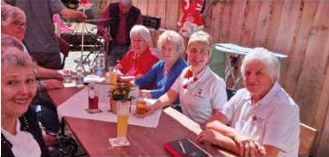
■ Herzliche Gastfreundschaft erlebten unsere Mitglieder auf der Griesner Alm