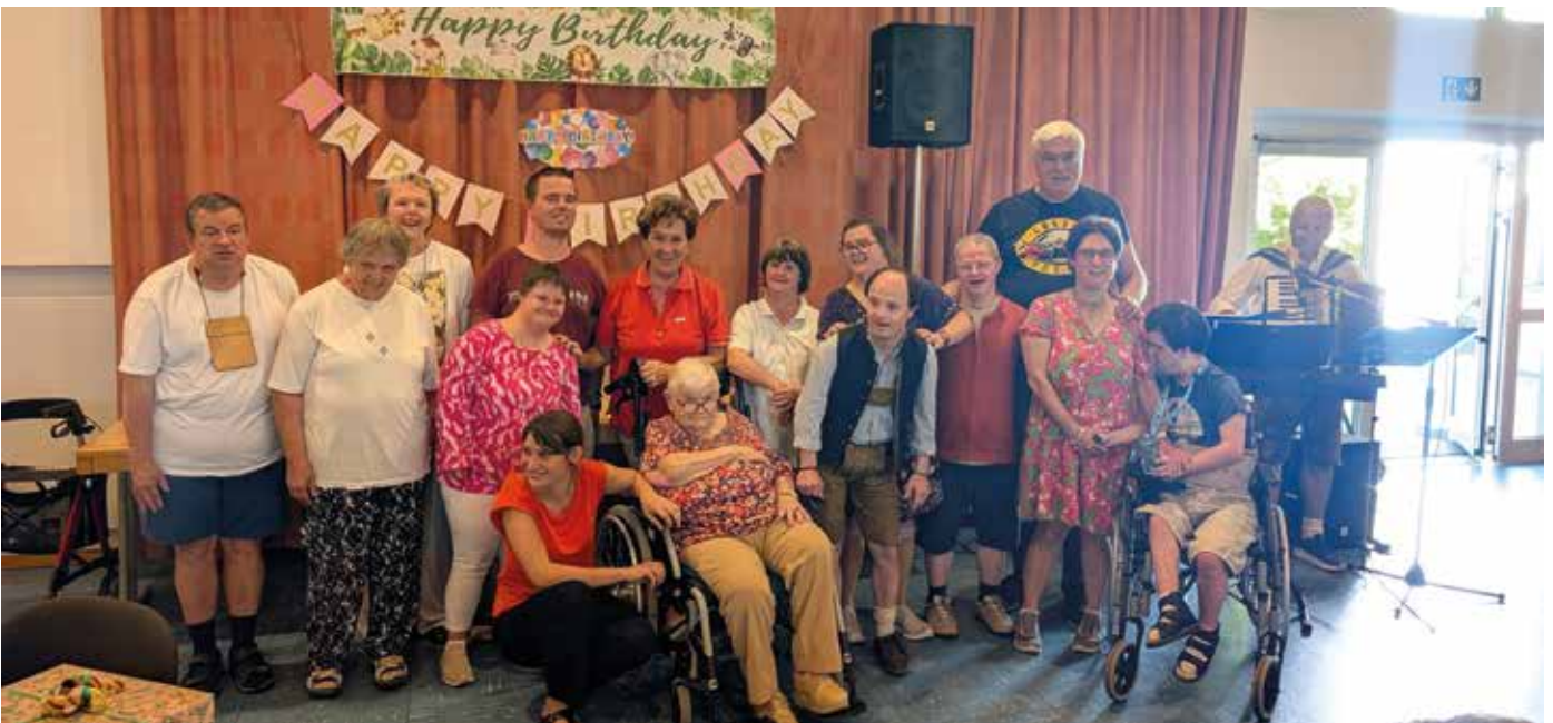
▼ Die Geburtstagskinder werden gefeiert

Unter tosendem Applaus, strahlenden Gesichtern und auch ein paar Tränen in den Augen wurde auf jedes Geburtstagskind angestoßen und alle wurden gebührend gefeiert. So verbrachten alle Freunde einen gemütlichen Nachmittag und alle Geburtstagskinder nahmen voller Stolz ihre Geschenke mit nach Hause.