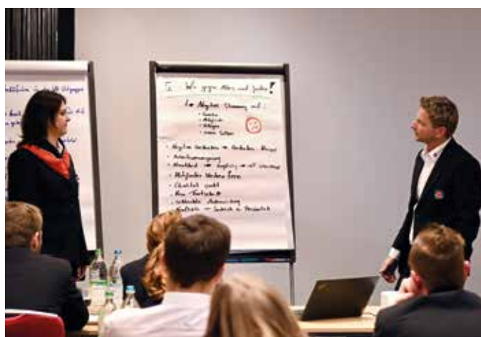
■ Präsentation der Coaching-Ergebnisse

der der Kreiswasserwacht – von Organisationsstrukturen über Ausbildungsthemen bis hin zu neuen Projekten im Bereich der Wasserrettung.