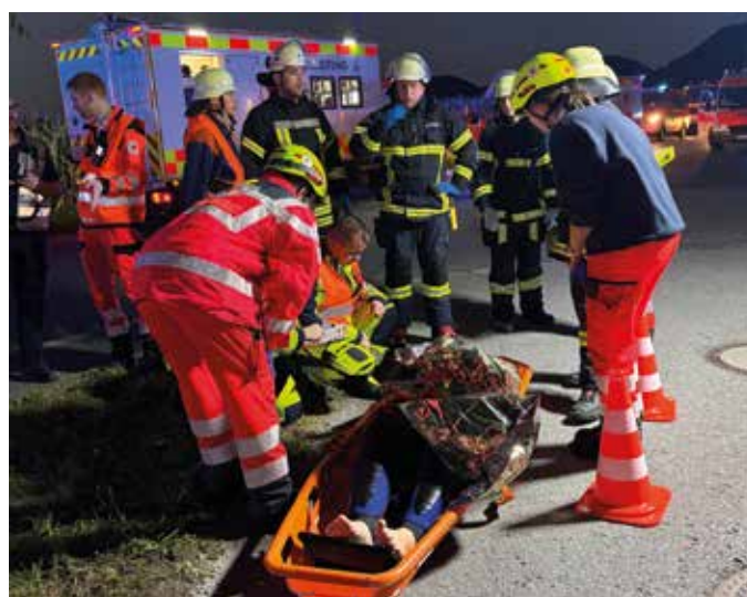
■ Medizinische Versorgung der Verunfallten