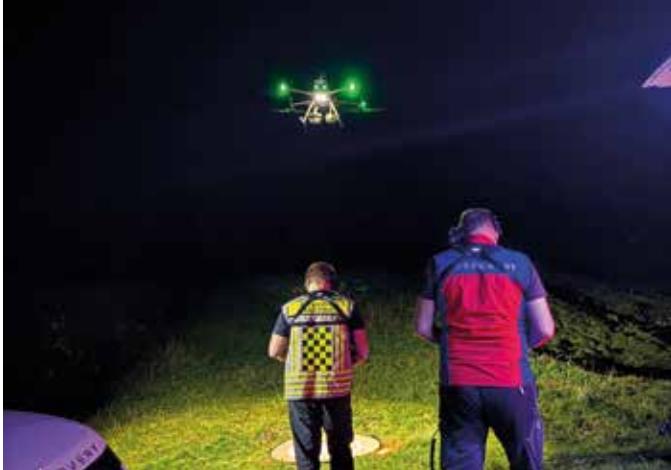
■ Suche mit der Drohne nach verunfalltem Gleitschirmflieger

Im September und Oktober kam es gleich zu drei Einsätzen auf dem Sulzberg. Während sich einer als Fehlalarm herausstellte, musste bei den beiden anderen jeweils eine verletzte Person behandelt und abtransportiert werden.