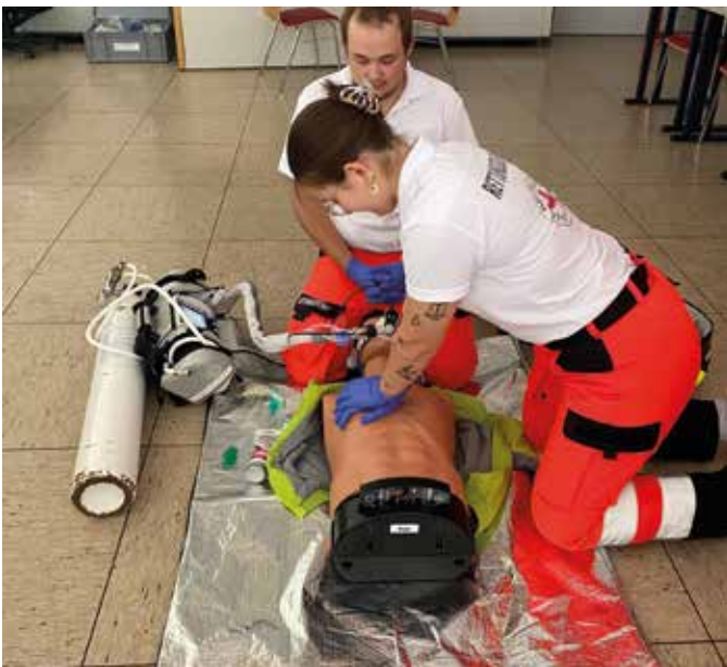
■ Übung von Notfalltechniken stand auf dem Programm

Für die Abschlussjahrgänge fanden außerdem drei ganztägige Examenstrainings statt. Mit Fallbeispielen und Fachgesprächen simulierten wir die Prüfungsrealität in einem geschützten Rahmen. Unterstützt wurden die Examenschüler von ehemaligen Prüflingen, die nicht nur ihr Wissen weitergaben, sondern auch die Praxisanleiter bereicherten. Alle Trainingseinheiten boten wertvolle praxisnahe Erfahrungen, stärkten das Selbstvertrauen der Auszubildenden und bereiteten optimal auf die Abschlussprüfungen vor.