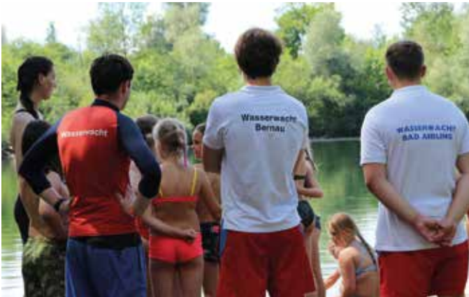
■ Badespaß am Happinger Ausee

Im Juni trafen sich rund 120 Kinder, Jugendliche und Betreuer auf dem Jugendfreizeitgelände des Stadtjugendrings am Happinger Ausee für das Zeltlager der Rotkreuzjugend. Bei hochsommerlichen Temperaturen standen ein Wochenende lang Spiel, Spaß und jede Menge spannende Programmpunkte auf dem Plan.