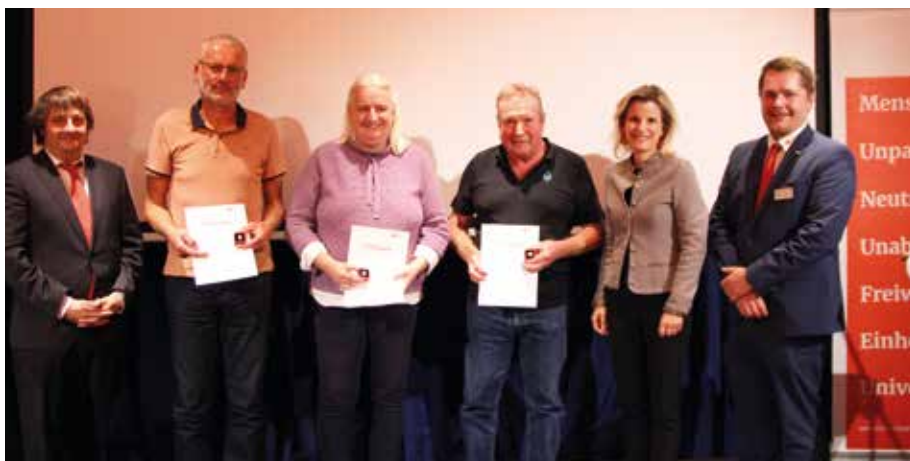
■ Stellvertretend für alle Geehrten hier die Blutspender, die 125-mal gespendet haben

Der BRK-Kreisverband Rosenheim bedankt sich von Herzen bei allen Geehrten – für ihre Zeit, ihr Engagement und ihre Treue. Sie sind das Fundament, auf dem die Arbeit des Roten Kreuzes in der Region ruht.