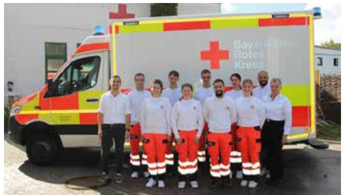
■ Unsere "Neuen" starten ihre Ausbildung

Wir wünschen allen einen guten Start, eine spannende Ausbildungszeit und freuen uns auf viele gemeinsame Rettungsdienstschichten.