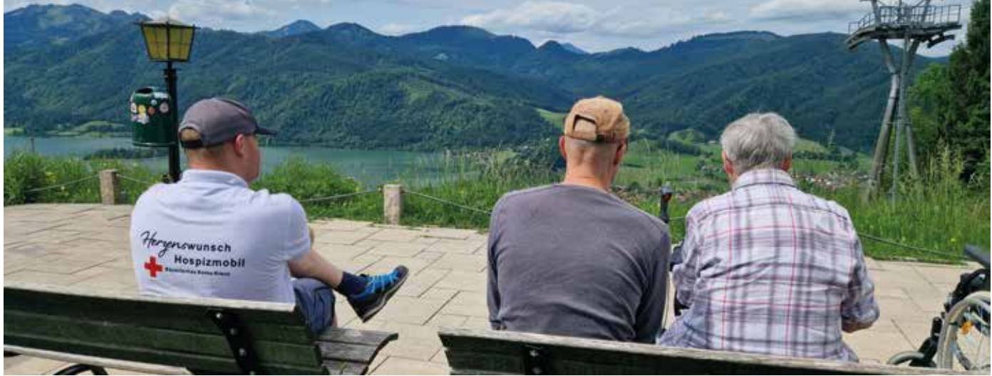
■ Blick in die Berge vom Schliersberg aus