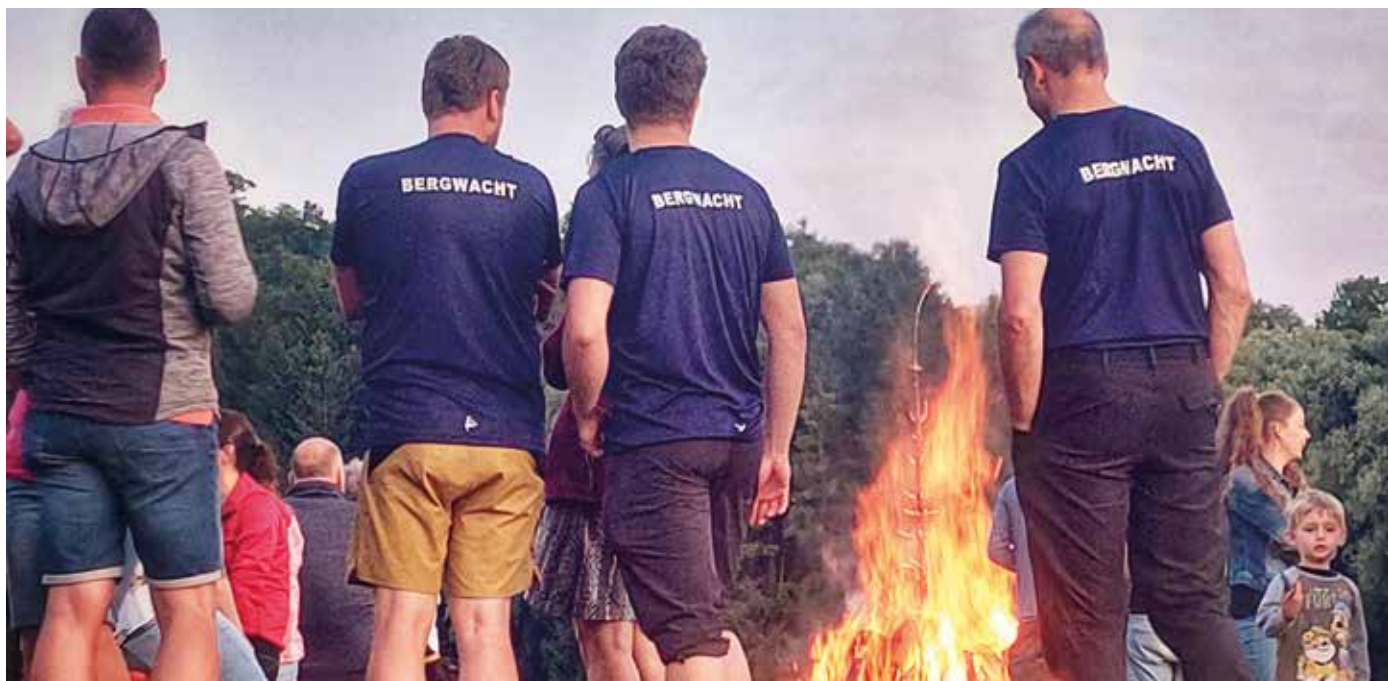
▼ Sonnwendfeuer der Bergwacht Oberaudorf

Die Kleinen durften eine Runde mit dem Einsatzfahrzeug drehen und das Blaulicht ausprobieren, während die Erwachsenen bei entspannter Musik neue Kontakte knüpften oder alte Freundschaften pflegen konnten. Das Feuer brannte langsam nieder und der Abend endete gemütlich und stimmungsvoll und weckte Vorfreude auf das nächste Jahr.