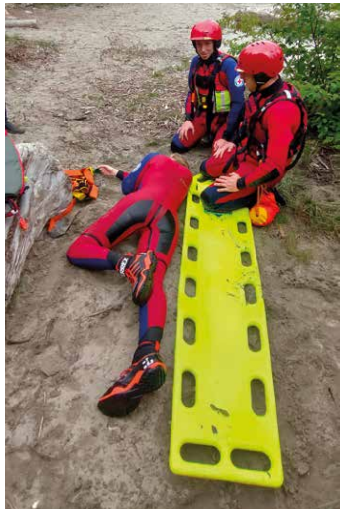
■ Stabile Seitenlage