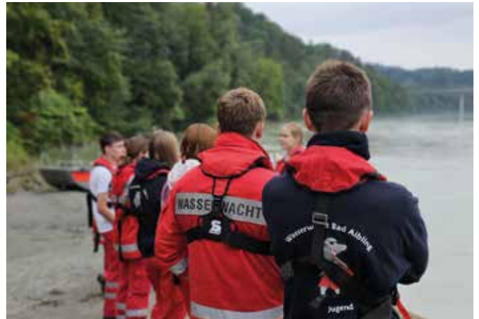
■ Gemeinsam üben die Aiblinger und Wasserburger am Inn

Bei Einsätzen mit Boot und Jet-Ski erlernten die Teilnehmenden den sicheren Umgang im fließenden Gewässer und wurden mit den Herausforderungen der Wasserrettung vertraut gemacht. Auch ihre Kenntnisse in Erster Hilfe wurden in realitätsnahen Szenarien praktisch angewandt und vertieft.