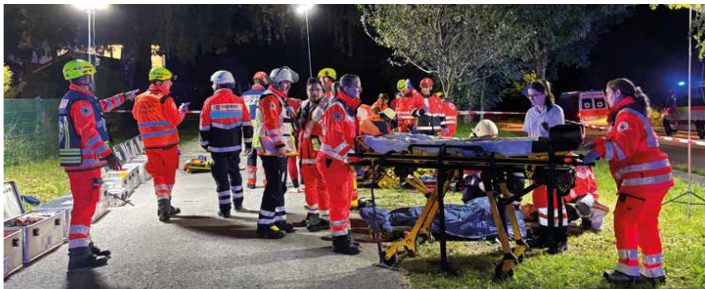
■ "Chemieunfall mit eingeklemmter Arbeiterin und zahlreichen Verletzten"

Im Herbst nahmen die Bereitschaften Rohrdorf und Prien an einer großangelegten Übung in Flintsbach teil. Gemeinsam mit weiteren BRK-Gemeinschaften und Vertretern von den Maltesern und Johannitern sowie zahlreichen Feuerwehren und der Polizei wurde ein schwerer Chemieunfall auf einem Firmengelände simuliert. Ziel war die fachdienstübergreifende Zusammenarbeit bei einem komplexen Einsatz.