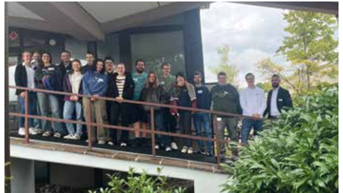
■ Die jungen Freiwilligen starten ihren Dienst

Für die jungen Leute ist ihr Engagement eine spannende Erfahrung, eine Zeit der Orientierung und ein Einblick in das Berufsleben. Für unseren Kreisverband wiederum ist diese Art der Mitarbeit ein großer Mehrwert für die Durchführung unserer Aufgaben. Für 2026 werden bereits Bewerbungen angenommen!